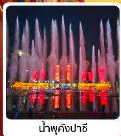
น้ำพุคังปาซี

● ไอลาร์ เป็นทราseyเสียงชาวมองโกล แหล่งท่องเที่ยวระดับ 5A ของจีน ภูเขาไฟอูลันฮาตา น้ำพุคังปาซี น้ำพุที่สูงที่สุดในเอเชีย