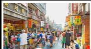
เมืองโบราณต้าชี่

ล่องแพไม้ไผ่ชมแม่น้ำหลี่เจียง - กางวงช้าง ทำฟลุ่ย์อ้อ - เมืองโบราณต้าชี่ เจดีย์เงินเจดีย์ทองวิฑู ซ้อปั้งถนนคนเดิน - ถนนคังซีเซียง - ถนนซีเจียง เมบูพิศษ บูฟัพศซาบูซีฟุด ปลาอบเบียร์ สุกี้เท็ด