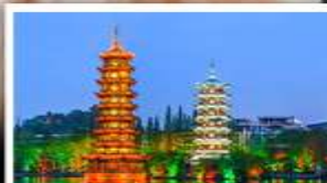
เจดีย์เงินเจดีย์ทอง