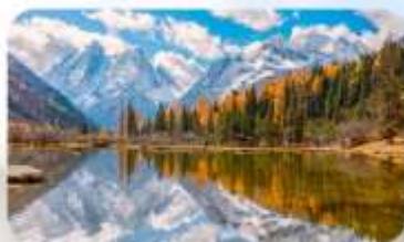
สี่ครุณี