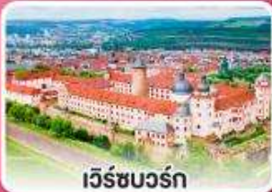
เวิร์ชบวร์ค