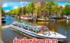
สองเรือหลังคากระจก