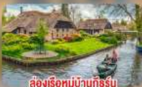
สองเรือหมู่บ้านทึร์น