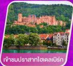
เข้าชมปราสาทไฮเดลเบิร์ก

เที่ยวเทศกาลดอกไม้เคอเคนฮอฟ ชมแคว้นอาลซัส หมู่บ้านสวยที่สุดในฝรั่งเศส เยือนเมืองมรดกโลก