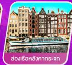
ส่องเรือสิงคภาระงก

✈️ เดินทาง 01- 08 เม.ย. 69 | 30 เม.ย.- 07 พ.ค.69