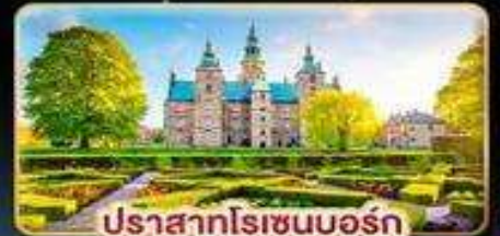
ปราสาทโรเซนบอร์ก