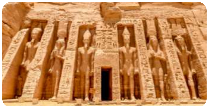
สมควรแก่เวลานำท่านเดินทางกลับเมืองอัสวาน