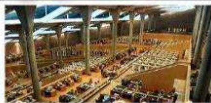
ห้องสมุดอเล็กซานเดรีย