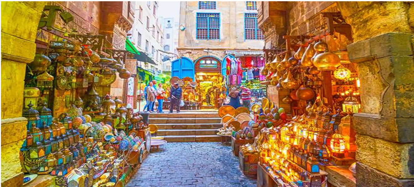
นำท่านออกเดินทางสู่สนามบินไคโร