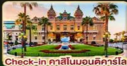
Check-in คาสิโนมอนติคาร์โล