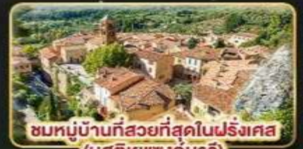
ชมหมู่บ้านที่สวยงามที่สุดในฝรั่งเศส (มูสติเยแซงก์มาร์)