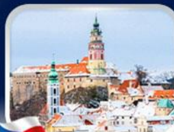
เมืองเช็ก คุลมลอฟ