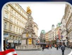
ช้อปปิ้งคาร์ทเนอร์สตรีก