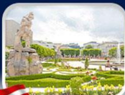
สวนมิราเนียล ซาลซ์บูร์ก