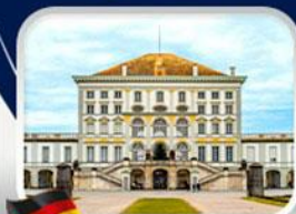
พระราชวังนินเฟนบูร์ก