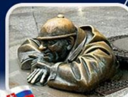
ประติมากรรม Cumil

มาเรียนพลาซซ์•บ้านเกิดโมสาร์ท•พระราชวังฮอฟบวร์ก•ซาลส์บวร์ก•บ้านเกิดโมสาร์ท•เกรโกเดร์สตรีก•ทะเลสาบคอนิกซ์•หมู่บ้านอัลส์สตัดท์•อนุสาวรีย์มาเรียเทเรซา