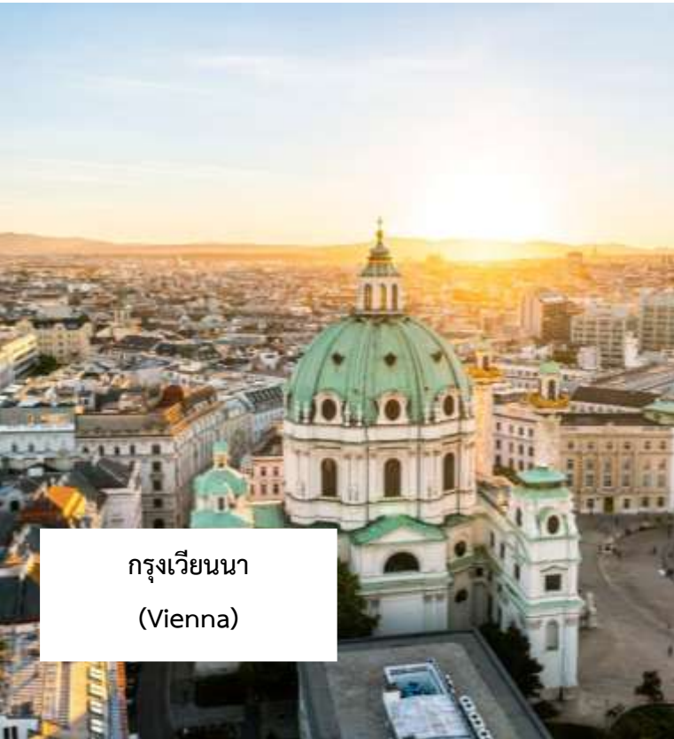
กรุงเวียนนา (Vienna)

เมนูพิเศษ!!! กุลาชชูป อาหารประจำชาติฮังการี