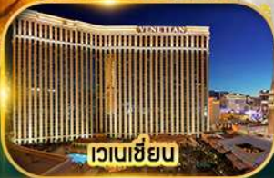
เวเนเซียน