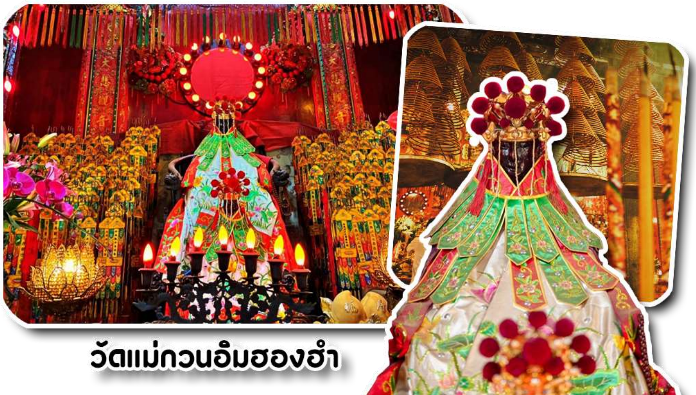
วัดแม่กวนอิมฮ่องฮำ

1873 เป็นวัดขนาดเล็กที่มีชาวฮ่องกงศรัทธาแน่นทึบกันเป็นอย่างมาก วัดแห่งนี้เป็นที่ประดิษฐาน องค์เจ้าแม่กวนอิมฮ่องฮำ ที่มีชื่อเสียงเรื่องการให้กู้ยืมเงิน เชื่อกันว่าท่านช่วยพลิกฟื้นเศรษฐกิจของชาวฮ่องกง ผู้คนจึงนิยมมายืมเงินทำธุรกิจจนสำเร็จร่ำรวย รุ่งเรือง โดยให้ท่านอธิษฐานขอพรต่อหน้าเจ้าแม่กวนอิมฮ่องฮำ พร้อมกับระบุวันเวลาในการขอพรด้วย จากนั้นนำธูปธูปตามฐานะและศรัทธาที่เ้าจะนำเป็นสื่อในการขอพร เขียนจำนวนเงินที่ต้องการลงไปด้วย ใส่สกุลเงินยิ่งดีใหญ่ แล้วนำเงินใส่ในซองแดง ควรเตรียมซองแดงไปเอง นำซองแดงไปวนรอบกระถางธูป วนขวาจำนวน 3 ครั้ง แล้วเก็บซองแดงในกระเป๋าสตางค์ เป็นเงินขวัญถุง ถ้าประสบความสำเร็จตามที่มุ่งหวังให้นำเงินในซองแดงทำบุญหยอดตู้ที่วัดแห่งนี้ในโอกาสต่อไป วิถีไหว้ให้ปัง ให้ได้โชคลาภเงินทอง ต้องไปกับเจ้าเท่านั่น