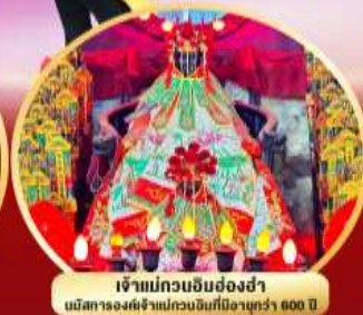
เจ้าแม่กวนอิมย้งฮงซ่า นมัสการองค์เจ้าแม่กวนอิมที่มีอายุกว่า 600 ปี