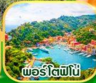
พอร์ตโฟฟิโน