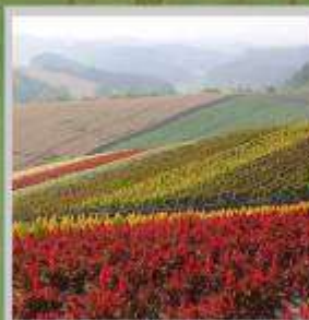
"SHIKISAI NO OKA"