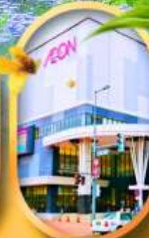
อีออนมอลล์