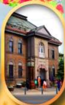
พิพิธภัณฑ์กล่องดนตรี