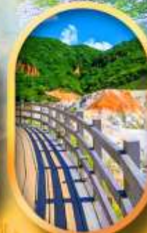
โนโบริเบทสึ