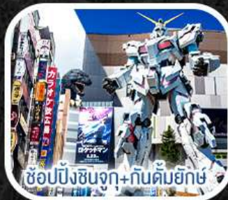
ช้อปปิ้งชินจูกุ+กันดั้มยักษ์