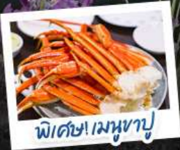
พิเศษ! เมฆหุบ