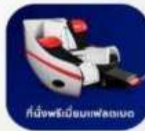
ที่นั่งพรีมีอิมเฟลทเบด