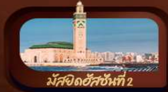
มัสยิดฮัสซันที่ 2

บิ๊อฟพิเศษ อาหารไทย-จีน อาหารพื้นเมืองโมร็อกโก