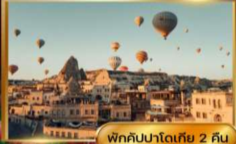
พิกคิปปาโดเกีย 2 คืน