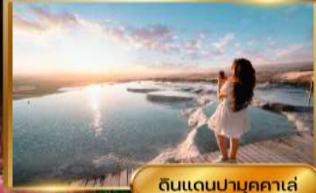
ดินแดนปามุคคาเล่