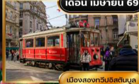
เมืองสองทวีปอิสตันบูล