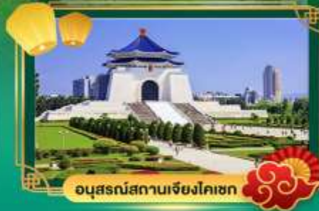
อนุสรณ์สถานเจียงไคเชก