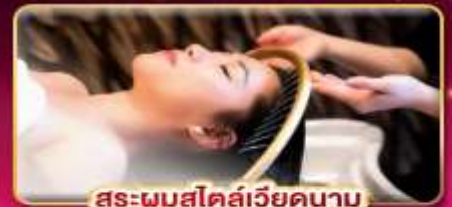
สระผมสไตล์เวียดนาม