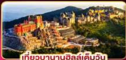
เที่ยวบานาฮิลล์เต็มวัน

ล่องกระทงขามดำคืนที่ฮอยอัน ไฟล์ทสวย บินเช้า-กลับเย็น