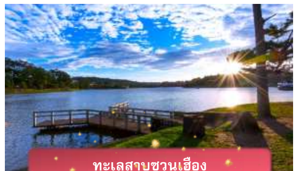
ทะเลสาบชวนเอียง

ที่พัก The Western Hill ระดับ 4 ดาวหรือเทียบเท่า