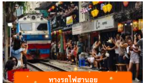
ทางรถไฟฮานอย

เช้า บริการอาหารเช้า ณ ห้องอาหารของโรงแรม นำท่านเดินทางสู่ วัดเจ็ญกั๊ก วัดริมทะเลสาบที่เก่าแก่ที่สุดในฮานอย สงบ สวย และ สะท้อนวัฒนธรรมเวียดนามได้อย่างลึกซึ้ง หลังจากนั้นนำท่านเดินทางสู่ ทางรถไฟฮานอย เป็นแหล่งท่องเที่ยวที่ได้รับความนิยมในกรุงฮานอย ประเทศเวียดนาม จุดเด่นของที่นี่คือ ทางรถไฟที่วิ่งผ่านย่านชุมชนที่อยู่อาศัย ทำให้เกิดภาพวิถีชีวิตที่แปลกตาและเป็นเอกลักษณ์ ท่านสามารถทดลองชิมกาแฟแท้ๆจากเวียดนามได้ที่นี้ อาทิ กาแฟนมเวียดนาม ที่มีความเข้มข้น กาแฟไข่มุกรวมหอมละมุน หรือกาแฟเกลือที่ทำให้ความรู้สึกแปลกแต่อร่อย อย่างบอกไม่ถูก (ไม่รวมค่าเครื่องดื่ม)