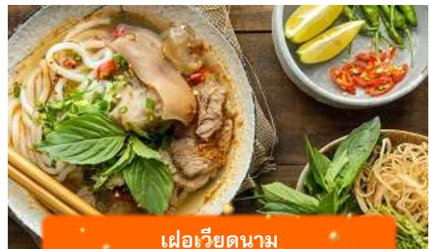
เฟอเวียดนาม

เที่ยง บริการอาหารกลางวัน ณ ภัตตาคาร พิเศษ ... เมนูเฟอไก่เวียดนาม ได้เวลาอันสมควรนำท่านเดินทางเข้าสู่ สนามบินนอยไบ เพื่อเดินทางกลับประเทศไทย 15.55 นำท่านเดินทางสู่ สนามบินสุวรรณภูมิ ประเทศไทย เที่ยวบินที่ VN619 (บริการอาหาร และเครื่องดื่มบนเครื่อง)