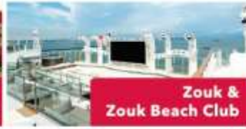
Zouk & Zouk Beach Club