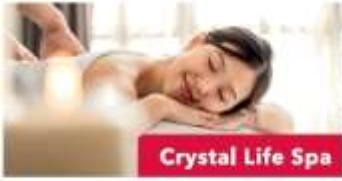
Crystal Life Spa