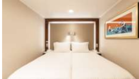
พัก 1-2 ท่าน

From 13 - 14 sq.m Max Occupancy 2-4 ^ Deck 5/8/9/10/11/12/13/15 2 Single Beds / 2 Single Beds + 1 Ceiling Pullman Bed / 1 Single Bed + 1 Pullman Bed + 1 Double Sofa Bed