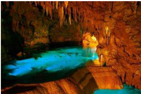
Gyokusendo Kingdom Village

ราคาผู้ใหญ่ 1,900 NTD/ท่าน ราคาเด็ก 1,700 NTD/ท่าน