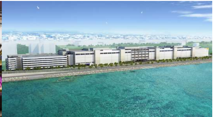
SAN-A Urasoe West Coast Parco City