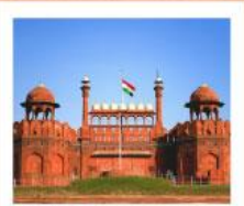
♥♥♥ Agra Fort