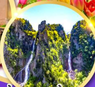
น้ำตกกิ่งกะ-น้ำตกริวเซ