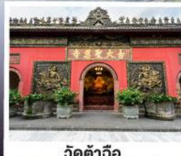
วัดตำฉือ