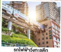
รถไฟฟ้าวังกะลุคัก