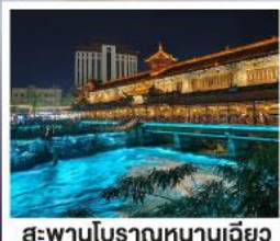
สะพานโบราณหนานเฉียว