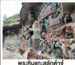
พระหินแทะสลักตำจู้