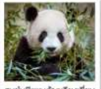
ศูนย์หมีแพนด้าฉงชิ่งเจียงเยียน