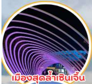
เมืองสุดล้ำเซินเจิ้น