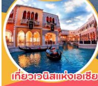
เที่ยวเวนิสแห่งเอเชีย