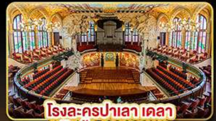
โรงละครปาเลา เดลา มูสิกา คาคาลานา