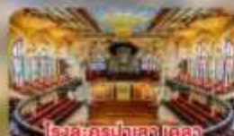
โรงละครปลาส เดลลา มูสิคกา คาตาลา