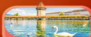
สะพานไมซ์ฮาลด์