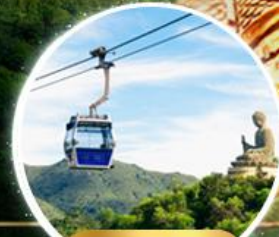
รวมกระเช้าฮ่องกง