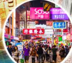
Shopping Taim Sha Tsui