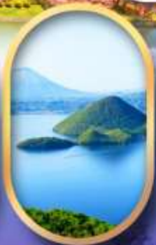
อิวทะเลสาบโทยา