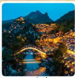
คุบเขาวังเซียนกู่