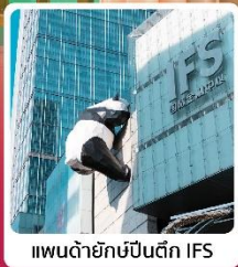
แพนด้ายักษ์ปั้นตึก IFS