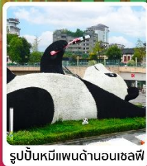
รูปปั้นหมีแพนด้าอนุเชลฟี