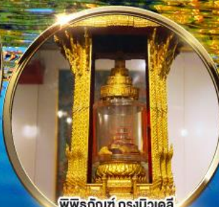
พิพิธภัณฑ์ กรุงนิวเดลี กราบมัสการพระบรมสารีริกธาตุ