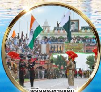
พิธีลดธงชัยแดน อินเดีย-ปากีสถาน ผ่านวากาห์

บินภายในไป-กลับ DEL ATO IXC DEL นั่งรถไม่เหนื่อย