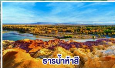
ธารน้ำห้าสี