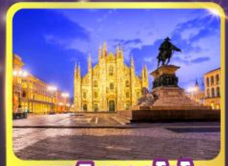
มหาวิหารคูโอโม