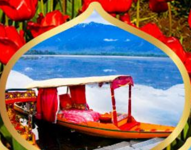
ล่องเรือชิคาร่า