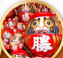
วัดคัตสึโอยิ (วัดदारุมะ)

ชมความงามของกำแพงหิมะ เส้นทางสายอัลไพน์ทาทยามา (JAPAN ALPS SNOW WALL)