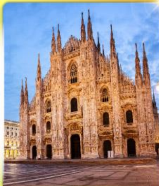
คูโอโมมิลาน