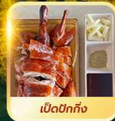
เปิดปอกกิ้ง