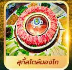
สุกีสโตลมองโก