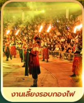
งานเลี้ยงรอบกองไฟ