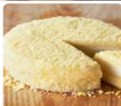
ร้าน LeTAO ร้านมีผลิตภัณฑ์ด้วย ตัวบรรยากาศในร้านตกแต่งด้วยไม้ที่ผสมผสานกัน อิงกลิ่นด้วยตัวขนมรสจากแบบมีรสฝาด