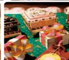
กล่องดนตรี MUSIC BOX