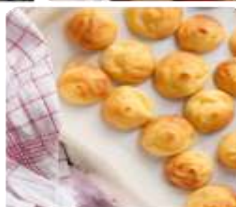
ร้าน KITAKARO ซึ่งเป็นขนมอบจากเตาสดๆ ที่เมื่อก่อนให้ชื่อขนมเป็นชื่อขนมที่ชื่อว่า และเพราะที่จะชื่อของมาเป็นชื่อร้าน