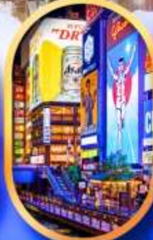
ย่านชิบะฮาชิจิ