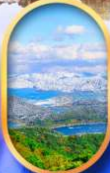
ทะเลสาบมิกะตะ