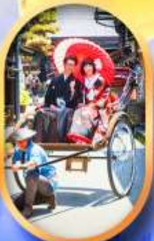
ศาลเจ้าจิ้งจอก