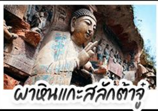
พ่าหิ้นเกาะสลักต้าจู่