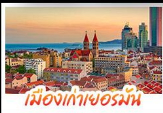
เมืองเก่าเยอรมัน

เมืองเก่าชิงเต่า - สลับกับเมืองโบราณหมิงสุ่ย เมืองเก่าเยอรมัน - ไรไวน์ฟางยู - สวนสตรอว์เบอร์รี่