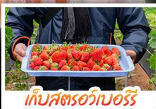
เก็บสตรอว์เบอร์รี่