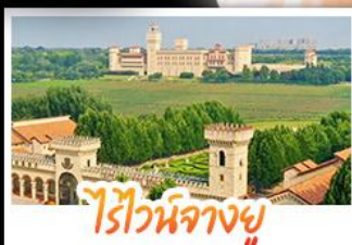
ไรไวน์ฟางยู